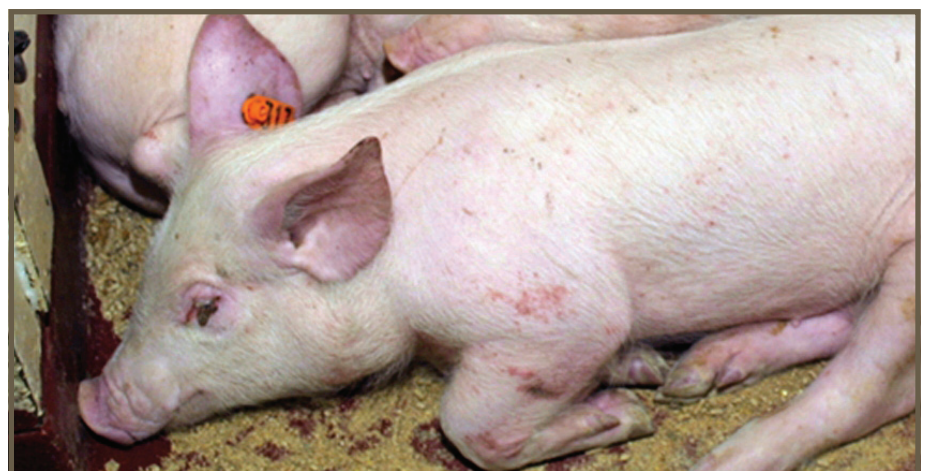
DECOLORACIÓN DE LA PIEL