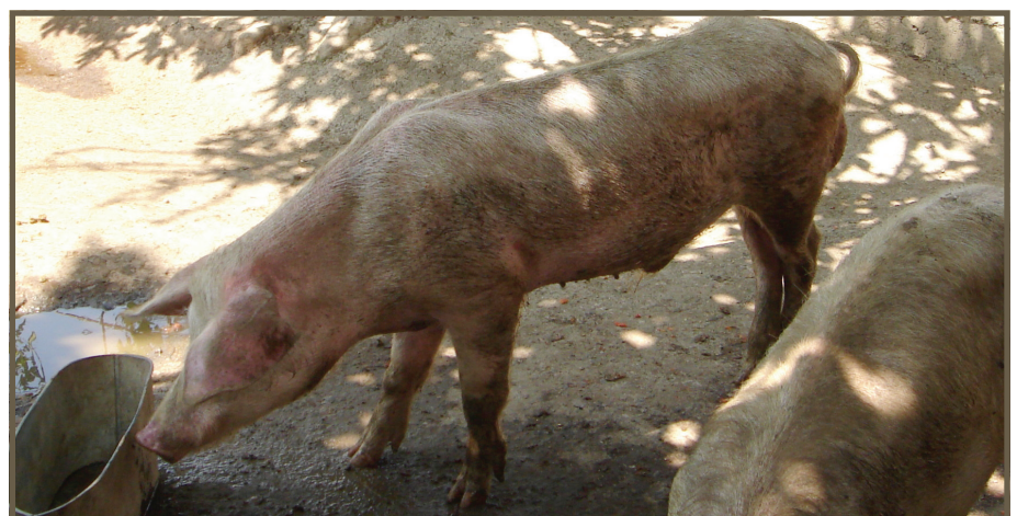
DISMINUCIÓN DEL APETITO

Los cerdos infectados con PPC se asemejan a aquellos animales infectados con varias enfermedades domésticas o exóticas tales como, la peste porcina africana (PPA), síndrome respiratorio reproductivo porcino agudo (SRRP), enfermedad asociada al circovirus porcino (PCVDs, por sus siglas en inglés), síndrome dermatitis y nefropatía porcino (SNDP), parvovirus, seudorabia, y enfermedades septicémicas tales como erisipela, salmonelosis, pasteurelisis, actinobacilosis e infecciones por Haemophilus parasuis . Cuando observe animales exhibiendo los signos clínicos mencionados arriba, sospeche de PPC y contacte a su médico veterinario.